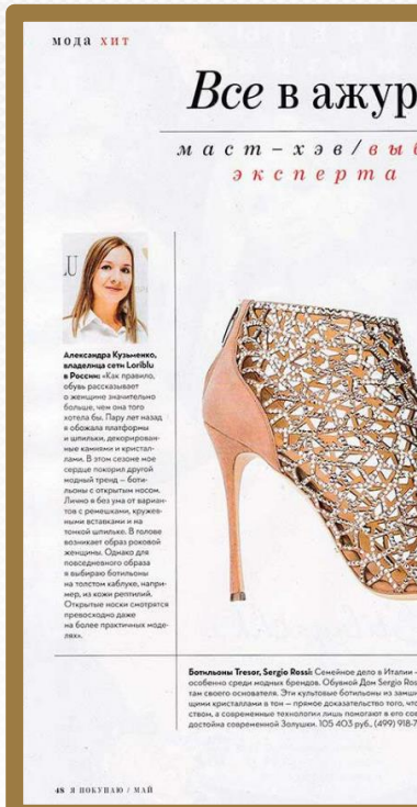
Журнал «Я покупаю», май 2016

Поскольку популярность бренда постоянно растет и это, безусловно, обеспечено нашим PR-отделом, мы приняли решение расширяться по регионам. Опыт в Ростове-на-Дону показал высокую динамику роста интереса потребителей к продукту, что не может не радовать нас. И в связи с этим, предлагаем вам присоединиться к нашей команде!