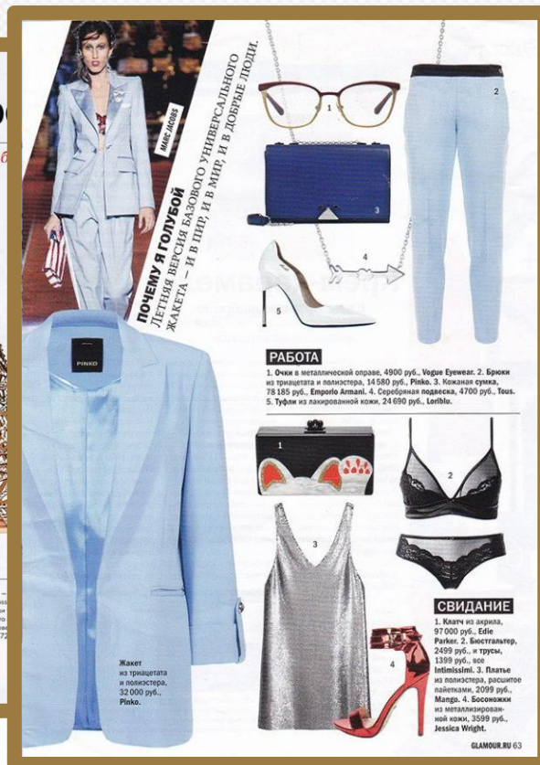
Жакет из трикотажа и ловеастера, 32 000 руб., Pinko.