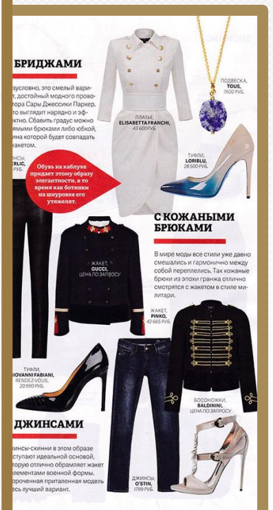
Журнал «Cosmopolitan», сентябрь 2016